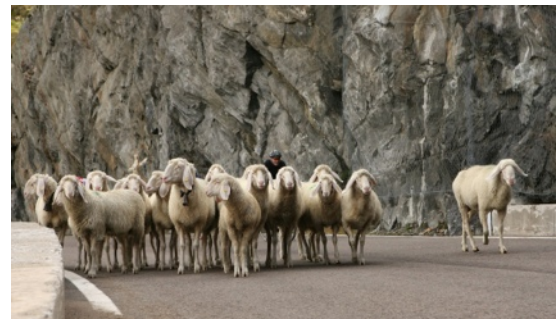
Schafe blockieren den Weg

dem ich mich eine ganze Zeit das Timmelsjoch hoch unterhalten hatte, meinte die Schafe wären wohl zu "sheepish". Aber gut. Die letzten Meter zur Passhöhe des Timmelsjoch ging es dann mit 6-7km/h im Wiegetritt - abwechselnd im Windschatten.