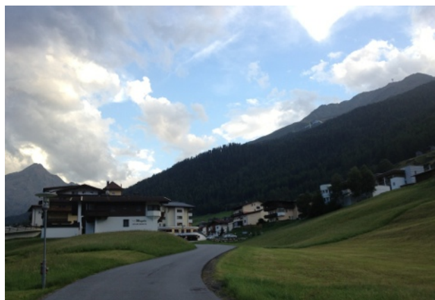
Unsere Hütte für die nächsten 3 Tage