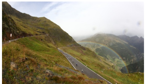
4 Jahreszeiten: Sonne, Regen, Schnee

Mir ist schon am Kühtai aufgefallen dass ich nicht mehr auf das kleinste Ritzel schalten konnte, eigentlich wollte ich am Jaufen zum Service - Servicestationen gab es an jeder Labe - das habe ich nur vor lauter Photos machen prompt vergessen. Mist! Das Timmelsjoch hoch hätte sich eine 30/27 sicherlich sehr viel besser gemacht als eine 30/25. Zudem fing nun auch noch das Schaltwerk an zu knacken, wenn ich aus dem Sattel bin. Aber was jammere ich, sind doch sicherlich 99% der andern mit Kompaktkurbel unterwegs gewesen.