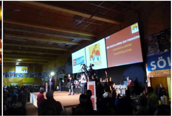
Ehrung der letzten Teilnehmer