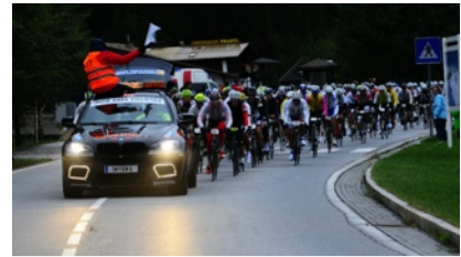
Mit dem Pacecar nach Ötz

einfach: Beim Start einigermaßen hinten anstellen. Mit moderatem Tempo die Abfahrten runterkommen und gemäßigt die Anstiege rauf - nicht überpacen, das Rennen beginnt am Timmelsjoch. Dabei immer brav trinken und essen: 2 Gels und 1 1/2 - 2 Flaschen je Anstieg so war der Plan. An den Verpflegungsstationen (Labe) immer ausreichend Pause machen und etwas salziges futtern.