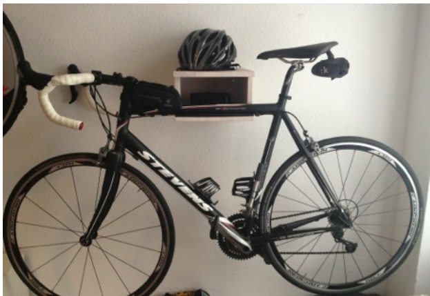
Mein fahrbarer Untersatz für den Ötzi.

Mit den ersten "Bergen" und einer Königsetappe mit immerhin 210km und knapp 3.000hm in den Beinen, war der Plan für die Monate von März bis zum Öztaler am 26. August klar: so gut es geht Kilometer sammeln und auch mal den ein anderen Berg im Training fahren. Im wesentlichen hieß das über den Willi kurbeln und die Wetterstation an der Teufelsee chaussee rauf und wieder runter und rauf und wieder runter... Neben den gewohnt unterhaltsamen und abwechslungsreichen, samstäglichen SISU Ausfahrten mit gelegentlichen Schleifen über die Havelchausee davor oder danach habe ich die Kilometer vor allem in diversen RTFs gesammelt: bspw. bei der Spreewälder Gurken RTF (wer hätte gedacht das eine grün angesprühte Blechgurke so schwer sein kann), dem SISU Frühjahrsklassiker (lecker Kaffee bzw. in meinem Fall Cola und Kuchen in Wittenberg) oder bei Rund um Berlin (zweimal) - für letzteres bin ich noch einen Bericht schuldig, den ich hiermit offiziell nachreiche: "Es war nass, und zwischendurch auch mal 'ne Stunde trocken.". Wirklich zielgerichtet habe ich für den Öztaler Radmarathon nicht trainiert, da ich ja als aktiver Gesundheitssportler und aktives Mitglied eines Triathlonvereins vor allem der Kombination aus Schwimmen, Radfahren und Laufen fröne. Die Trainingspläne die Nana mir bis zum Marathon geschrieben hat (Vielen Dank, scheint ja bisher ganz gut geholfen zu haben ;-)) fielen dennoch ein wenig radbetont aus. Dies sollte also meine Vorbereitung für den Ötzi sein.