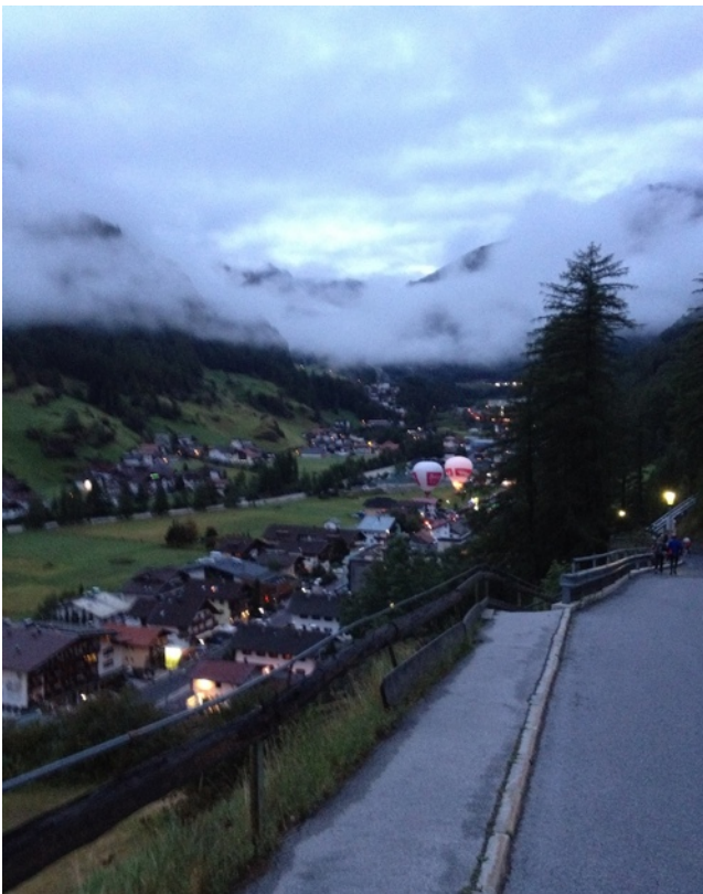
Blick auf die Hauptstrasse von Sölden