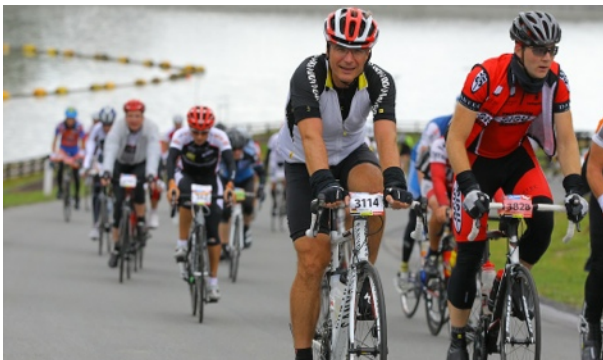
Der letzte Anstieg vor der Labe am Kühtai

Nach der Schrecksekunde ging es rasant weiter nach Ötz und vor dort direkt in den ersten Pass: Ötz-Kühtai. Insgesamt ca. 18,5km lang und 2.020m hoch. Eine maximale Steigung von 18% (im Mittel aber deutlich weniger). Die Besichtigung am Vortag entspannte mich - und auch meinen Puls - ein wenig. Ich wusste wenigstens ein bisschen was mich im Verlaufe der nächsten 1 1/2 Stunden erwarten würde. Die Stimmung auf den Kühtai hoch war der Hammer, links und rechts waren immer wieder Zuschauer über einem zog der Helikopter seine Kreise und Service-Bikes bzw. -cars pendelten durchs Feld. Mit jedem Meter Höhengewinn ergab sich ein noch besserer Blick auf das Tal in Ötz.