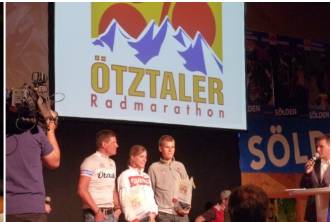
Ehrung der Gewinner