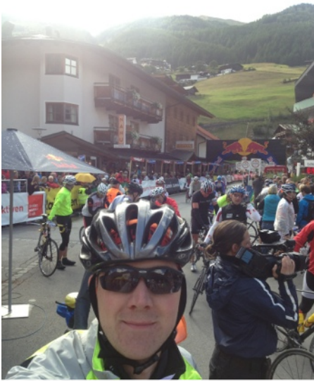
Geschafft: Glücklich im Ziel

fast 10 Stunden hinter und nur noch ein paar Kilometer ins Ziel vor mir: die 10 Stunden Marke knackte ich heute nicht mehr; insofern konnte ich dann auch den letzten kleinen Stich von Zwieselstein nach Sölden ganz locker nehmen und die letzten Kilometer nach Sölden ins Ziel zu rollen.