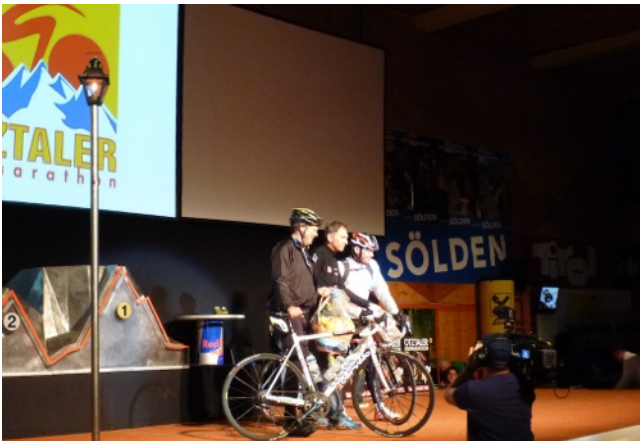
Ehrung der letzten Teilnehmer