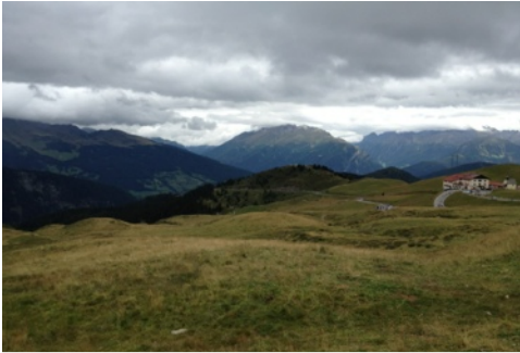
Blick von der Labe auf dem Jaufenpass

natürlich besser ist sich immer brav auf die nächste Kehre zu fokussieren). Mental war ich wieder auf eine Labestation an der Passhöhe eingestellt, als diese dann aber ein gutes Stück unterhalb der Passhöhe auftauchte war ich ein wenig überrascht. Nach der Labe direkt wieder in eine Wand zu fahren hatte ich irgendwie nicht auf dem Plan, es war doch Abfahren angesagt. Aber na gut, es war ja nur ein kurzes Stück bevor es dann endlich in die ersehnte Abfahrt ging. Während der Pause fing es ein wenig an zu nieseln, bei 2.090m war es zudem deutlich kälter als noch im Tal. Insofern habe ich Pause etwas kürzer gehalten und bin nach einem Suppen- und Photostopp zügig weiter gefahren. Das Alpenpanorama war selbst mit den aufziehenden Regenwolken super schön anzusehen.