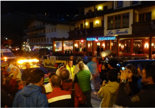
Ankunft der letzten Teilnehmer