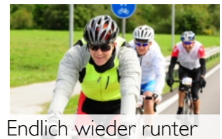
Endlich wieder runter

Die Abfahrt vom Brenner war nicht ganz so steil und auch nicht sonderlich lang, dafür aber mit einigen gut einsehbaren Geraden. Weidegatter gab es auch nicht und so habe ich es hier auch mal ein wenig Rollen lassen. Bis zum Fuss des nächsten Anstieges zum Jaufenpass der in Sterzing auf mich wartete.