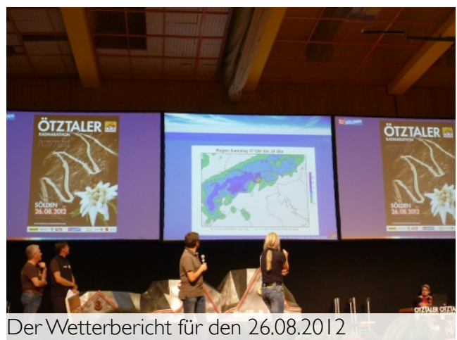
Der Wetterbericht für den 26.08.2012

Die Rennbesprechung endete mit einer Aussicht auf das Wetter. Es sollte in der Nacht ordentlich regnen und gewittern und auch am Renntag selbst sollte es vorerst noch nass werden. Mittags war aber schon von einem Aufklaren die Rede. Die Temperaturen sollten aufgrund einer Kaltfront auch noch deutlich nach unten gehen: 10-15° am Morgen sollten es sein. Na immerhin! Gar nicht so schlecht im Vergleich zu den Horror-Wetterberichten der vergangenen Tage. Sicherheitshalber habe ich dennoch an zwei Verpflegungsstationen je ein Set trockene bzw. dickere Klamotten deponiert. Man weiss ja nie.